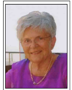
Brigitte Schwalm Geburtstagskarten